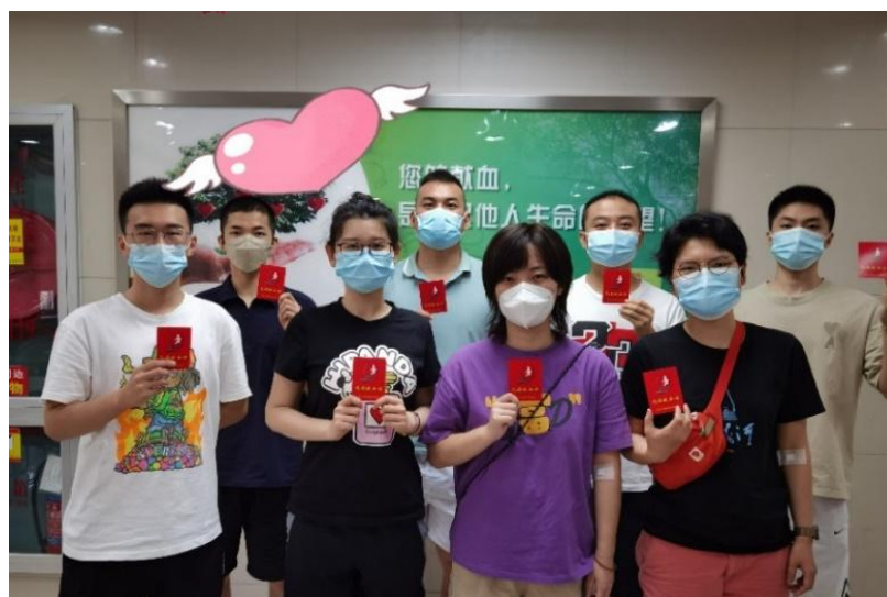
图 1-3 杨浦区中等职业学校师生积极参加年度献血工作

强化意识形态，形成有效机制。 杨浦区中等职业学校结合实际，关注中职学生的思想动态，学校党组织一方面将意识形态工作的考核纳入教师的日常考核中，坚持定期分析研究意识形态工作，加强阵地管理，做好舆情管控，另一方面则通过各种会议进行学习和宣讲。支部以“楷模激励我成长”为主线，举办世界冠军杨山巍团队事迹报告会、全国优秀教师张璇作师德报告、开展“向于漪老师学习”系列活动，在校内开展教育教学故事分享、教学技能比武、校师德标兵和优秀班主任评选、文明组室评选等。今年还结合教材的修订与规范，对教职工进行了“课程思政”专题培训，重点挖掘梳理各门课程的德育元素，充分发挥各门课程的育人功能，实现全程育人、全方位育人和全员育人的大思政格局学科思政。