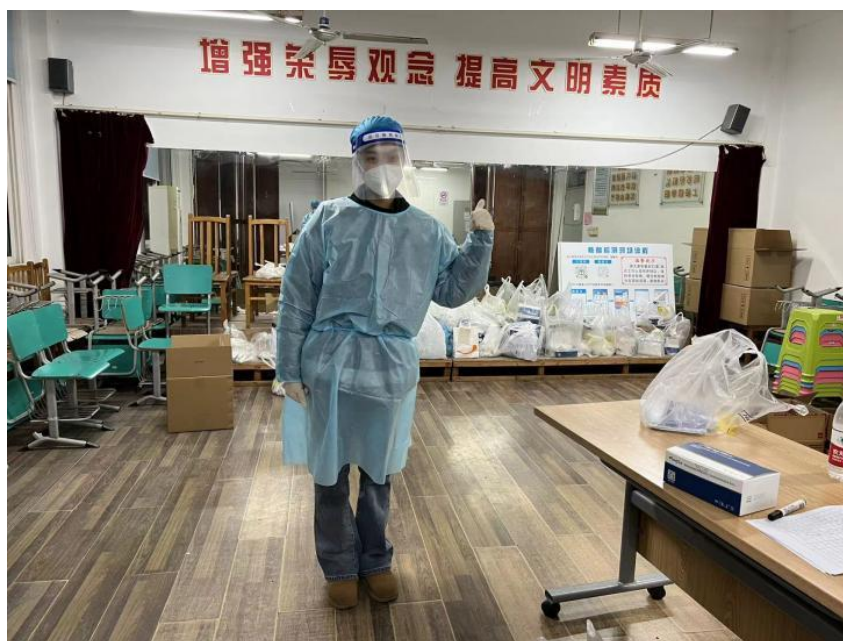
图 1-1 疫情期间党员教师深入参加社区志愿工作