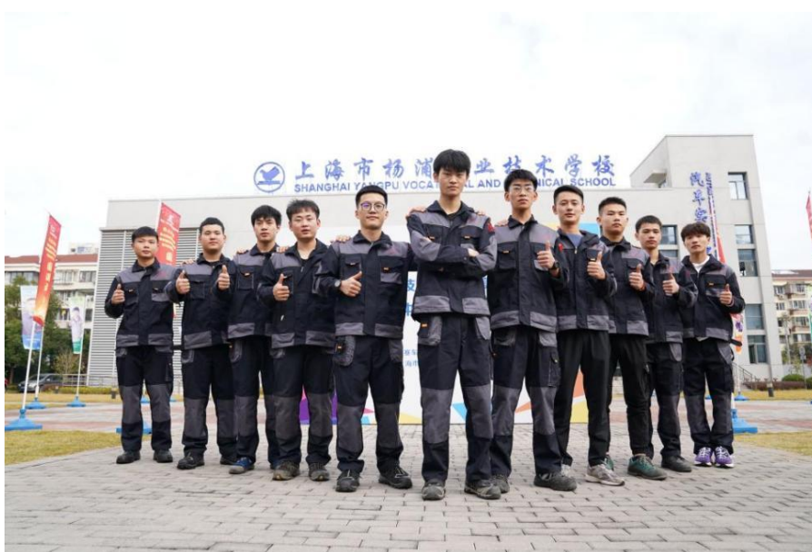
图 1-8 第 46 届世界技能大赛车身修理项目中国集训队上海站集训选手合影

牵头世赛项目集训，助力选手获得更好成绩。 作为第 46 届世界技能大赛车身修理项目中国集训牵头基地，杨浦区中等职业学校成立工作领导小组，从技术保障、设备保障到后勤保障层层落实，针对疫情防控现状制定了周密的方案，全力保障集训等各项工作顺利进行。世赛车身修理项目中国集训队上海站集训暨首次阶段性考核在学校基地举行，来自 11 个省市的选手参加集训，各展所能、同台竞技，近 80 余名专家、裁判、教练及赛务工作人员共同参与，5 名优秀选手晋级下一阶段集训，精进技能，力争共同实现车身修理项目新的辉煌。目前，学校已开始进行下一届世界技能大赛的备赛工作，继续发扬精益求精的工匠精神，展现新时代技能人才风采。