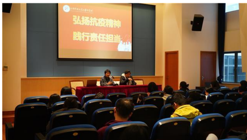
图 1-2 “扬抗疫精神，践行责任担当”主题党日活动

提倡党员引领，凝聚发展核心。 杨浦区中等职业学校把党支部建设成为教书育人的坚强战斗堡垒，把广大教职员工和师生最广泛地组织调动起来，党总支落实基层党建工作责任制，签订目标责任书，贯彻《中国共产党支部工作条例（试行）》，扎实开展支部建设，严格落实学习强国学习、“三会一课”、主题党日、党员民主评议、按期交纳党费等制度，引导党员强化身份意识和服务意识。学校领导干部以“强化学史增信、强化实践提质”为思路，聚焦党史理论学习，筑牢政治思想根基；把“带头学、带头抓、带头干”作为对班子成员的行动要求，班子成员任教、带教、带赛，带领教师共同成长。同时，学校以上海市信息化应用标杆培育校、上海优质中职培育校建设为契机，积极推进