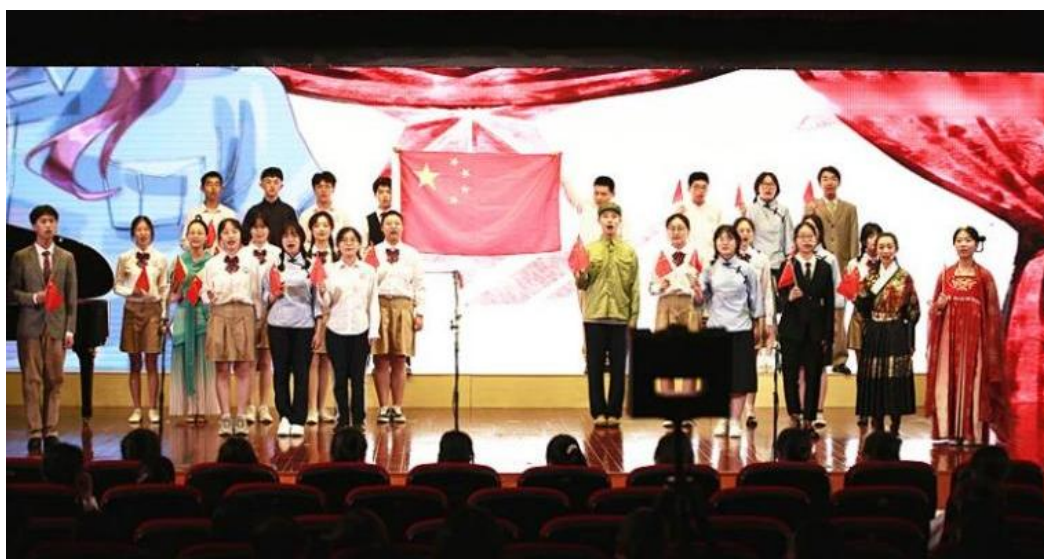
图 1-4 “喜迎二十大”十月颂歌歌咏大赛

开展主题教育，提高学生自我修养。 杨浦区中等职业学校通过升旗仪式、校班会、团课等途径，以观摩、讲座、实践等形式，以各种节日、宣传日、纪念日为契机，组织开展各项活动，培育和践行社会主义核心价值观。以喜迎喜庆二十大为主线，开展建团百年、“清明祭英烈”、“技能成才、强国有我”主题教育活动和文明风采活动、时政大赛、“学习新思想，做好接班人”主题活动、“强国复兴有我，争做‘文明小使者’”——杨浦青少年“喜迎二十大”系列主题实践活动、“四史”教育、“从一大走向二十大”党史知识云挑战、人文行走、征文演讲活动等，培养学生爱国情怀；通过“感念师恩”主题活动周、“同心共筑梦 奋斗正青春”毕业典礼等活动，培养学生感恩意识；通过全国禁毒日和全国法制宣传日活动，增强学生遵纪守法观念；通过各年级考试纪律教育，培养诚实守信的美好品德；通过学雷锋活动、垃圾分类、志愿者活动，培养学生社会责任感；通过“快乐劳动 助力成长”劳动，培养学生良好的劳动意识和生活习惯；通过开展“聆听抗疫一线子女心声”主题活动、“战疫”手势舞、战疫征文、鼓励学生争做抗疫小达人等，坚定学生理想信念、增强必胜信心。