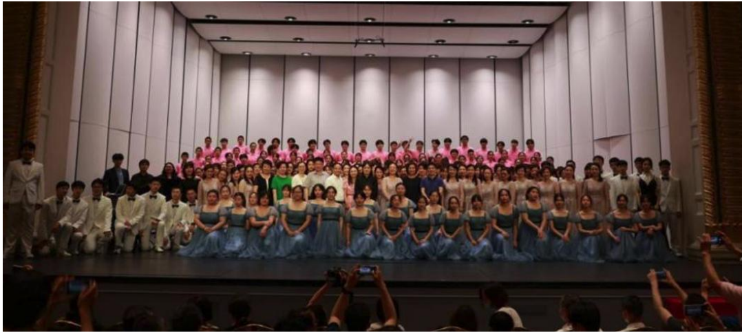
图 4-3 上海市中职学生星光合唱团