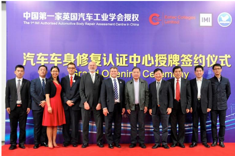
图 3-1 杨浦职校与英国 IMI 合作举行中国首家汽车车身修复认证中心授牌签约仪式