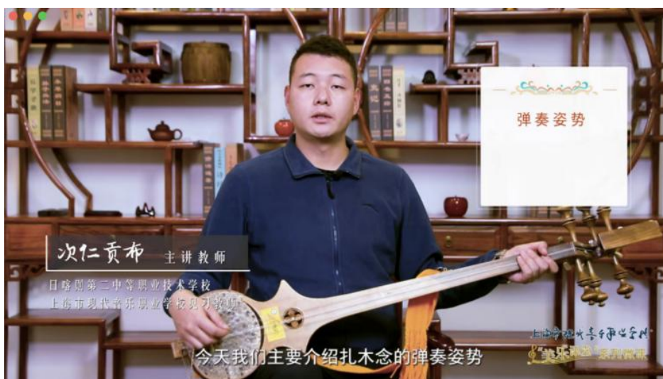
图 2-3 “美乐课堂”系列微课——扎木念

深化数字化课程内容。 杨浦区中等职业学校整合现有校级课程资源库，继续深化在线课程建设，基于各专业学生的学习特点，依据“五育并举”的要求，在顶层设计中树立思政嵌入式教学资源思想，将文化基础课与专业紧密结合，充分体现学校特色，并将思政教育落实于各学科微课：语文微课着重讲述辛弃疾的英雄气和英雄词，历史微课讲述移风易俗、破旧立新，地理学科的微课将气候、地形与当地的音乐风格相结合，英语微课展现中西方传统乐器的对比，旨在用英语讲中国故事。此外，现代音职还打造了“美乐课堂”——教师系列微课 16 课次，着手开发出“美乐课堂”——大师系列、毕业生系列和学生系列。