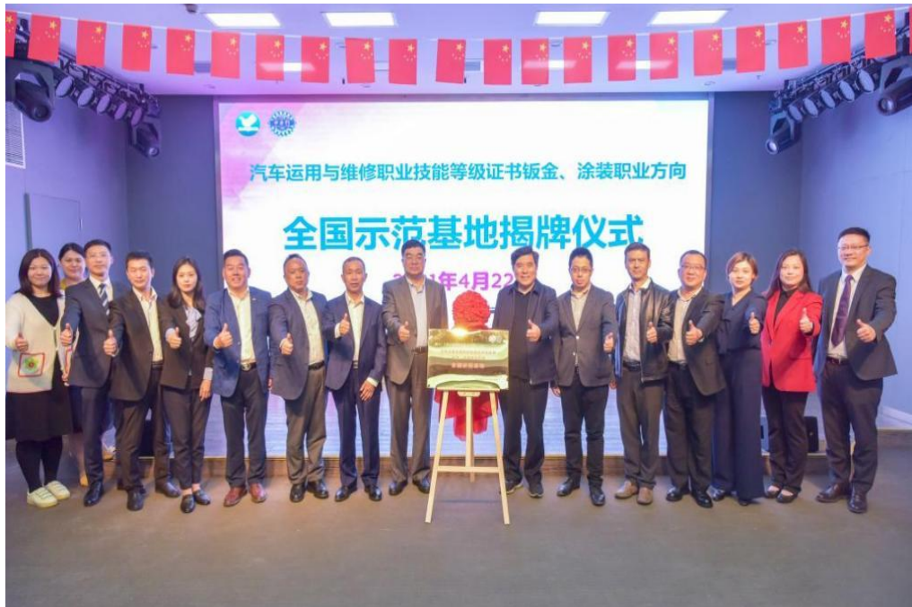
图 4-2 钣金、涂装职业方向全国示范基地揭牌仪式

资和技术技能人才，培训辐射全国 20 个省市，同时发挥“双基地”的辐射作用，服务全国师生，通过线上线下相结合的方式与各基地选手、全国兄弟院校开展交流活动，进行技艺切磋、教学研讨等活动，共同提升技术水平和教学能力。2022 年度，线下接待参观交流达 200 多人次，线上学习研讨达 3000 多人次。