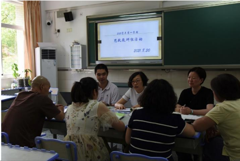
图 2-2 思政组教师开展《习近平新时代中国特色社会主义思想学生读本》进课堂专项研讨活动