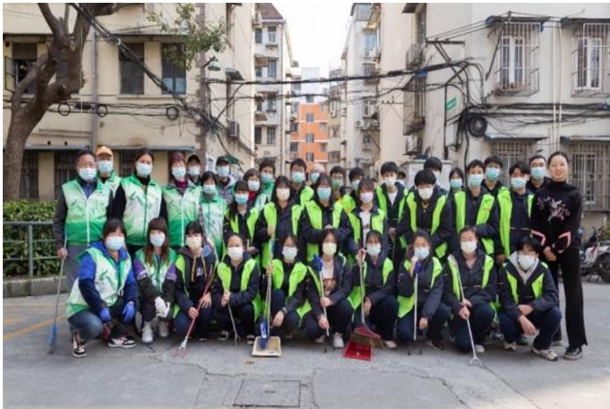
图 1-5 杨浦中等职业学校学生积极参加社区志愿劳动