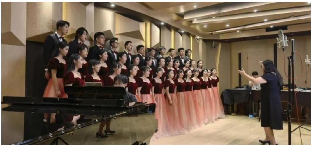
图 4-4 合唱作品《我的祖国》