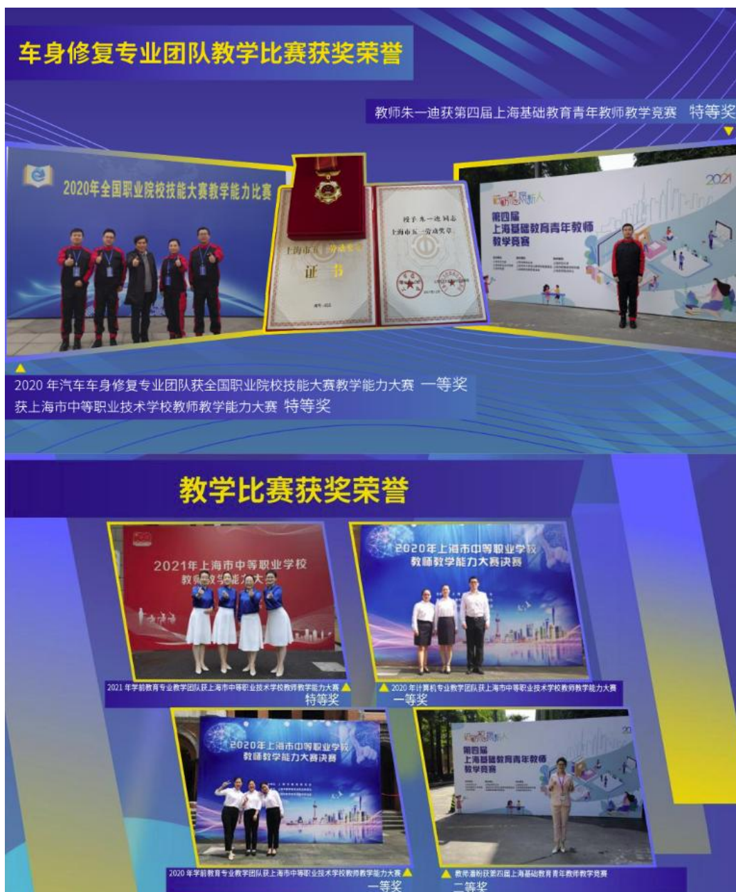
图 2-4 教师参加教学能力比赛获奖照