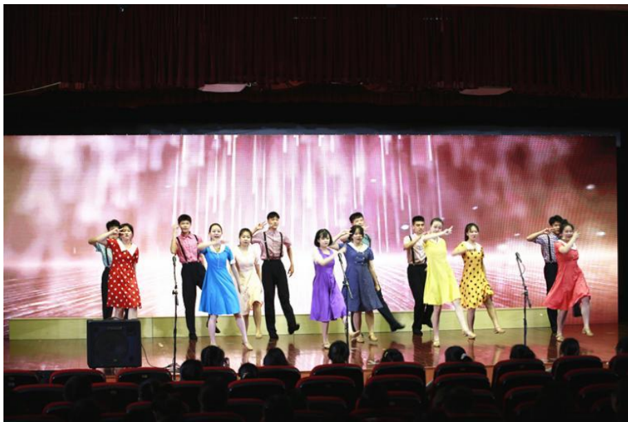
图 1-7 现代音职梦舞蹈社团获 2022 年杨浦区第三十五届学生艺术节单项比赛金奖

在社团活动方面，两校开展各项艺术教育活动和社团活动，加强对社团建设的指导，为学生校园活动和社会实践活动搭建更为广阔的平台。同时，学校加强对学生社团的组建和指导工作，开设了一批深受学生喜爱并积极参与的社团，不仅符合促进学生全面发展的指导思想，而且创设了生动活泼的育人环境。社团活动不仅是学校课堂教学的延伸性活动，更能通过组织丰富多彩的文化、艺术、体育等活动，激发学生学习兴趣，发展个性特长，促进学生身心健康发展。学校有舞蹈、合唱、音乐剧、啦啦操、面点制作、中餐烹饪、创意剪刻等 20 多个社团。依托社团，学校在市、区的比赛中屡获佳绩，包括 2022 年上海市中职学生合唱比赛一等奖、上海市学生阳光体育大联赛中职组健美操啦啦操比赛一等奖、2022 年杨浦区第三十五届学生艺术节单项比赛金奖，社团学生参加在上音歌剧院举办的上海市学生合唱节及在国际舞蹈中心举办的第七届校园文化节闭幕式演出。学校也将不断创新社团活动内容与形式，使校园文化向着健康、时尚、活力的方向发展。