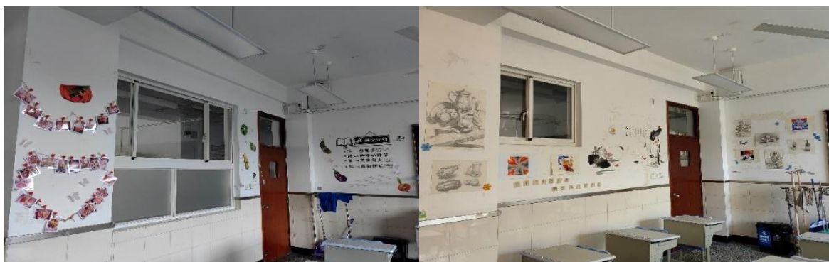
图 1-6 杨浦职校教室布置规范

2022年，杨浦区中等职业学校在学生素质和在校体验上均取得良好成绩。在学生素质方面，学校从学生的文化课合格率（学校考试）、专业技能合格率、体质测评合格率、双证书获取率和就业率五个方面进行衡量，除双证书获取率外合格率均高于90%。在双证书获取率方面，杨浦职校为96%，现代音职却为0，这与现代音职的音乐专业属性有关，详细数据见附表2-5。在在校体验方面，学校则继续通过问卷形式，从理论学习满意度、专业学习满意度、实习实训满意度、校园文化与社团活动满意度、生活满意度、校园安全满意度、毕业生对学校满意度和学生社团覆盖率进行评估，各满意度也均高于90%。详细数据见附表2-6。同时，学校也积极从其他方面，多维度考量学生在校体验。