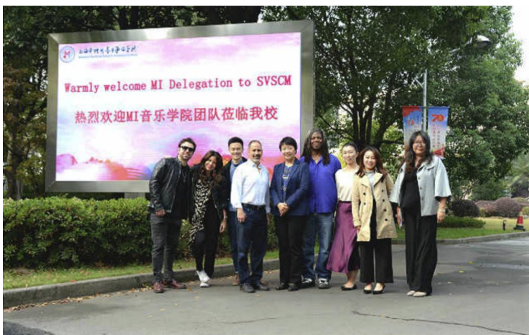
图 3-2 美国 MI 音乐学院参观访问

打通学生国际交流渠道。 杨浦区中等职业学校依托上海音乐学院等国内外音乐教育优质资源，与美国旧金山音乐学院、美国知名现代音乐学校 MI 音乐学院、韩国骊州大学开展校际合作，强势打造音乐教育品牌，为学生后续深造开启绿色通道。创建于 1977 年在音乐界享有很高声誉的美国 MI 现代音乐学院的教授团队在本学年莅临现代音职交流演出，与师生联合举办音乐会并进行现场大师课教学，对学校乐队社团的同学们进行了演奏技巧方面的现场指导，令同学们受益匪浅。同时，双方就师资、课程等方面形成更深入的、全方位的合作意向，希望加大国际化合作力度。